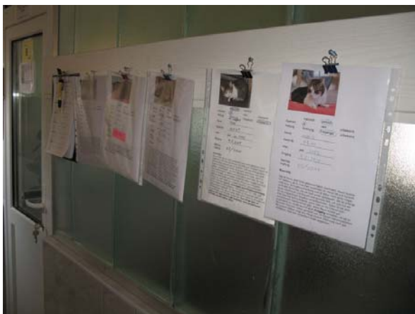
Abb. 8: Beschreibungen der Tiere

Neben der Gruppengröße ist der pro Katze angebotene Platz in einem Katzenraum ein wichtiger Faktor bei der Katzenhaltung. Katzen sollte es möglich sein eine Distanz von 1 – 3m einhalten zu können (ROCHLITZ, 2005). Als Angabe für die Mindestfläche in Gruppenhaltung wird 1,2 – 1,5 bis 4m 2 pro Tier und für jede weitere Katze 2m 2 angegeben (MICCICHÈ u. STEIGER, 2008). Laut KESSLER u. TURNER, 1999 sollten einer Katze mindestens 1,7 m 2 zur Verfügung stehen, denn bei diesem Flächenangebot war der Stress für die Katzen in einer Gruppe verringert. In den beurteilten Tierheimen reicht die Anzahl der Quadratmeter, die einer Katze zur Verfügung gestellt wird von 0,6 bis 5,4m 2 . Da das Perzentil 25 bei 1,9 liegt, kann man sagen, dass rund 75% die empfohlenen Mindestgrößen einhalten.