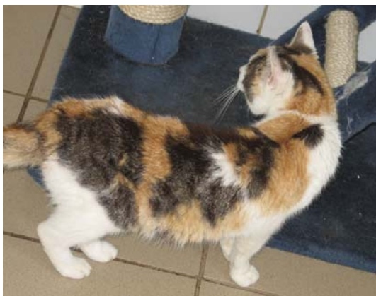
Abb. 4: sehr dünne Katze

Insgesamt war die Übereinstimmung zwischen 2 Beurteilern für Katzen besser als für Hunde. Dies könnte ebenfalls daran liegen, dass zu den Katzen persönlicher Kontakt möglich war, die Hunde aber nur von außerhalb des Zwingern beurteilt wurden und daher im Regelfall eine größere Distanz zwischen dem Tier und dem Beurteiler vorhanden war.