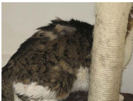
Abb.5: deutliche Abweichungen des Fells

Die wichtigsten Zusammenhänge, die zu einem höheren Anteil sehr dünner Katzen gefunden wurden, waren vor allem Merkmale der Ausstattung der Innenbereiche der Katzenhaltung wie weniger Liegestellen (um Distanz beim Liegen einzuhalten), weiche Liegeplätze, Versteckmöglichkeiten und Spielzeug als Katzen im Raum. Außerdem eine größere maximale Gruppengröße und geringere minimale Flächen pro Katze im Betrieb und ein schlechteres Raumklima (Geruch).