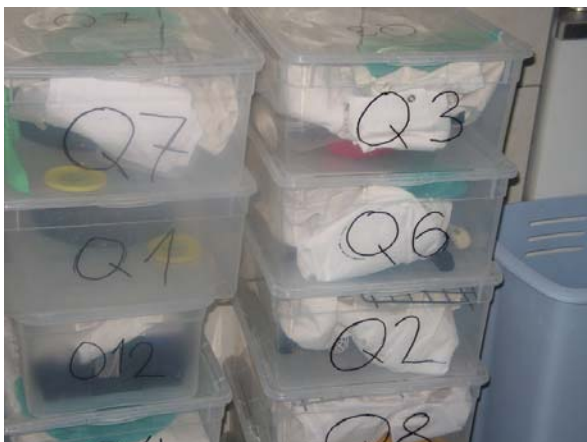
Abb. 12: Boxen mit allen nötigen Utensilien inkl. Mantel für jeden Quarantänekäfig

Im Hinblick auf das Wohlbefinden der Tiere musste festgestellt werden, dass Rückzugsbereiche/Versteckmöglichkeiten für Katzen nur in rund der Hälfte der Quarantänestationen vorgefunden wurden, obwohl diese nachgewiesenermaßen stressreduzierend wirken (siehe auch Kapitel Katzenhaltung).