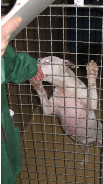
Abb. 3: Kontaktaufnahme mit der Erhebungsperson

Alle anfangs inkludierten physischen Parameter wurden bereits in Phase 1 ausselektiert, da sie nur sehr selten vorgefunden wurden und Verhaltensparameter wie Stereotypen oder innerartliche Aggression wurden ebenfalls bereits in Phase 1 aus verschiedenen Gründen (siehe Material und Methode) als wenig geeignet eingeschätzt.