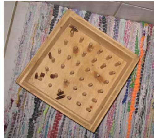
Abb. 11: Beschäftigung mit Futter

Insgesamt gesehen bieten viele der besuchten Tierheime den Katzen gute Lebensbedingungen und sind sehr bemüht das Wohlergehen der Tiere zu sichern. Leider gab es in rund 25% der Tierheime auch weniger optimale Situationen. Es gibt aber immer Möglichkeiten zur Verbesserung. Beispielsweise, die Ausstattung der Innenräume mit Liegestellen und Versteckmöglichkeiten scheint besonders wichtig für das Wohlbefinden der Tiere zu sein (siehe auch Kapitel „Tierbezogene Parameter“). Auch sollten Großgruppen vermieden werden, denn einerseits ist es für die Betreuer schwer den Überblick zu behalten und andererseits könnte dies für die Tiere vermehrten Stress bedeuten. Durch entsprechendes Management (z.B.: Anbringen von Kurzbeschreibungen mit Bildern und Checklisten, in denen täglich der Zustand einer jeden Katze kurz dokumentiert wird) kann in größeren Beständen leichter ein Überblick über den Zustand der Tiere behalten werden. Weiters sollten Katzen, die sich in Gruppen nicht wohlfühlen einzeln gehalten werden. Für eine längerfristige Einzelhaltung (über Quarantänezeit hinausgehend) sollten bei Nichtbestehen Räumlichkeiten geschaffen werden. Ein System zur Sicherung des Wohlbefindens der Tiere in den Katzenunterkünften könnte vor allem Betrieben mit wenig Fachpersonal Unterstützung geben.