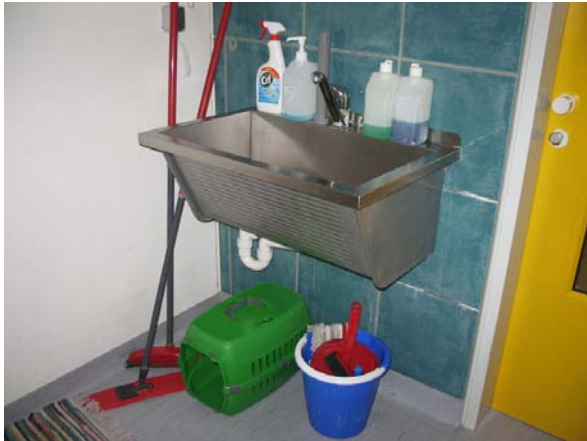
Abb. 10: Reinigungsgeräte, Transportbox und Handdesinfektionsmittel im Katzenraum

Da nur in rund 40% der Tierheime (siehe Kapitel Management von Infektionskrankheiten) bei Neuaufnahmen Routinescreeningtests auf Viruserkrankungen wie FeLV durchgeführt werden, wäre es sinnvoll, um die Transmission von Erkrankungen zwischen Katzenräumen zu vermeiden, für jeden Raum eigene Reinigungsgeräte zu verwenden und Überschuhe bzw. Seuchenteppiche zu benutzen. Dies ist allerdings nur selten der Fall: eigene Reinigungsgeräte kommen immerhin noch in rund 40% der Tierheime vor. Überschuhe oder Seuchenteppiche nur in etwa 10%. Bei unbekanntem Infektionsstatus besteht daher die Gefahr einer Verschleppung von Infektionskrankheiten über den gesamten Katzenhaltungsbereich.