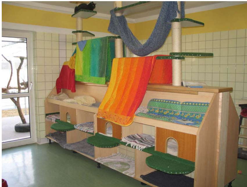
Abb. 1: Strukturierter Katzenraum mit vielen Versteckmöglichkeiten

Problembereiche zu identifizieren. Weiters soll eine erste Einschätzung der Reliabilität und Validität von tierbezogenen Parametern zur Beurteilung von Tierheimen erfolgen.