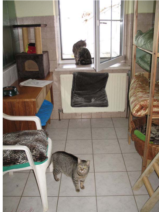
Abb. 7: kleine Gruppe in strukturiertem Raum

Für Katzen ist der Aufenthalt in einem Tierheim im Allgemeinen eine stressige Zeit. Besonders durch veränderte Routine, unbekannte Menschen und fremde Tiere kann Stress verursacht werden (MC COBB et al., 2005). Daher wäre es am besten für Katzen, wenn sie in einem Tierheim untergebracht werden müssen, die Aufenthaltsdauer möglichst kurz zu halten (MICCICHÈ u. STEIGER, 2008).