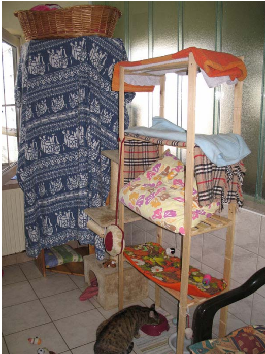
Abb. 6: Regal mit Tuch als Versteck

Andererseits liest man: „auch wenn das Tierheim in der Regel nicht jene Haltungsumgebung ist, wie sie etwa Freilaufkatzen auf dem Bauernhof oder im Einfamilienhaus vorfinden, lassen sich Gehege und Boxen derart gestalten, dass die Katzen viele arttypischen Bedürfnisse befriedigen können. Die Anforderungen an eine tiergerechte Haltung der Katzen ergeben sich aus deren natürlichen Verhaltensweisen“ (Berg, 1991 zitiert nach TRACHSEL, 1997).